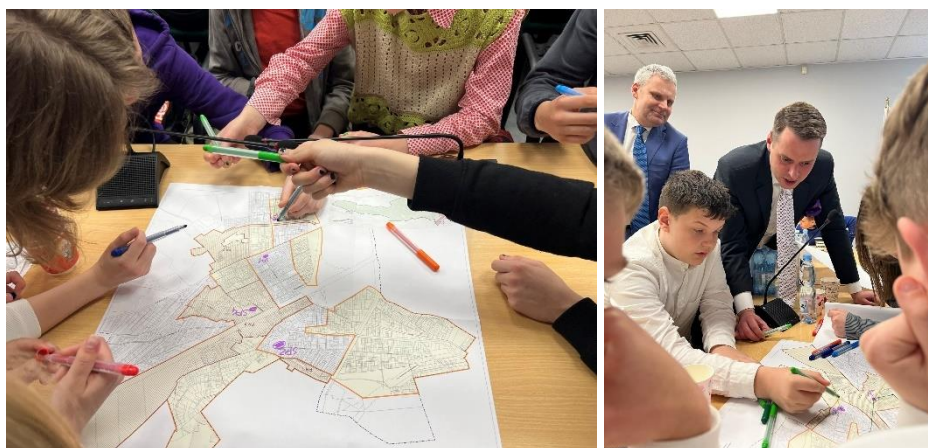
Zdj. 2. Spotkanie warsztatowe z delegacjami uczniów

Prezentacji każdej z grup towarzyszyła pełna emocji dyskusja na temat miejsc spędzania czasu wolnego, sposobów przemieszczania się po mieście, czy też dostępnej w Zielonce oferty kulturalnej. W przypadku każdego z tematów uczniowie byli proszeni o odwoływanie się do konkretnych miejsc zlokalizowanych na każdym z trzech podobszarów rewitalizacji. Postulaty zgłaszane przez uczniów dotyczyły m.in. stworzenia na terenie obszaru rewitalizacji nowych miejsc do spędzania czasu wolnego, poprawy stanu chodników i ścieżek rowerowych, czy też lokalizacji w Zielonce nowych punktów usługowych.