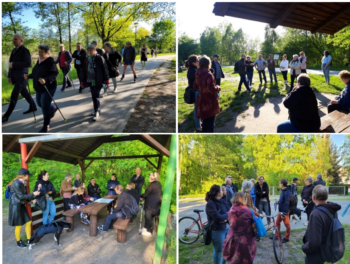
Zdj. 4. Uczestnicy trzeciego i czwartego ze spacerów badawczych, organizowanych w ramach konsultacji społecznych

Poligon, dostępności usług na terenie osiedla, a także sposobie zagospodarowania terenu dawnej bocznicy kolejowej.