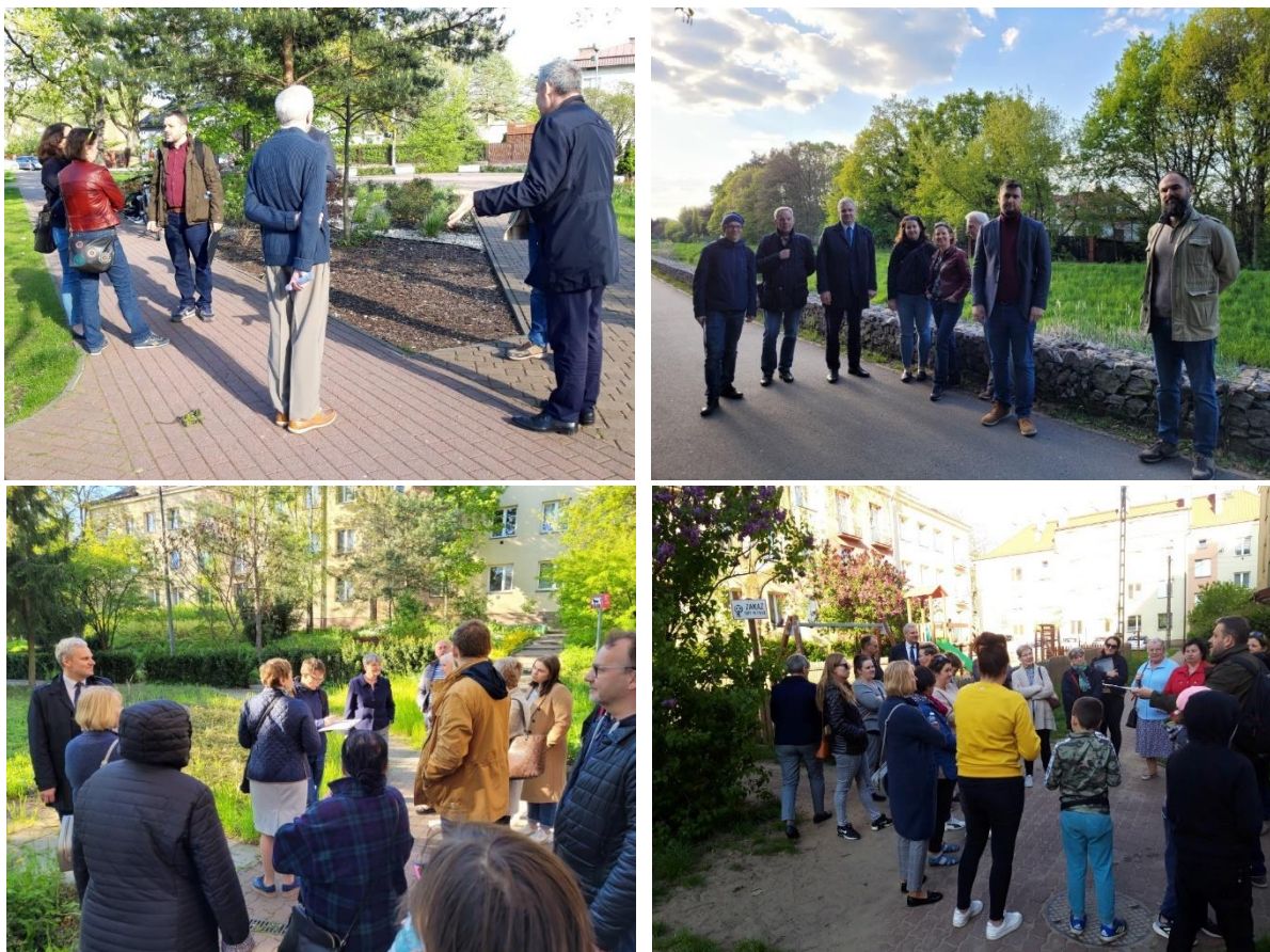
Zdj. 3. Uczestnicy pierwszego i drugiego ze spacerów badawczych, organizowanych w ramach konsultacji społecznych

Trzeci ze spacerów miał miejsce 10 maja 2023 roku. Jego uczestnicy zebrali się o godz. 17.00 w punkcie zbiórki przy Klubie „Senior+”, którego siedziba mieści się w Zielonce na ul. Przemysłowej 4. Temat zagospodarowania terenu Glinianek budzi żywe zainteresowanie, nie tylko wśród mieszkańców obszaru rewitalizacji, o czym świadczy fakt, że w spacerze wzięło udział około 20 mieszkańców miasta. Podczas spaceru po Gliniankach rozmawiano o wyzwaniach związanych z zapewnieniem odpowiedniego poziomu wody w zbiornikach wodnych, a także zachowaniem ich czystości. Mieszkańcy oraz przedstawiciele organizacji społecznych działających na obszarze Glinianek zgodnie twierdzili, że teren ten stanowi unikatowy w skali regionu zasób i potencjał, a także – że istnieje potrzeba wprowadzenia rozwiązań, które ułatwią równoczesne korzystanie z Glinianek przez różne grupy mieszkańców. W drugiej części spaceru jego uczestnicy dyskutowali o zmianach, które zaszły w ostatnich latach na terenie osiedla Wolności. Poruszano między innymi kwestie dotyczące integracji sąsiedzkiej oraz bezpieczeństwa.